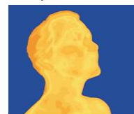
Hot and humid